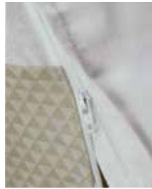
※①ファスナーで簡単 衿付け！

汗をかくこの季節は少しでもサラリとした洗いやすいものが重宝しますよね。特に長じゅばんは汗をかくとすぐに洗濯したいですよね。そんなお悩みを解決する『き楽つく』をご紹介します。