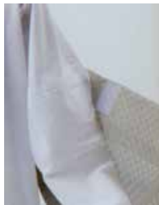
※②袖の取り外しやサイズ調整が出来る！

胴は綿のサラリとした素材で裾よけはポリエステルとキュプラの素材で、肌触りと裾さばきのいい素材で使い勝手も抜群。家で洗濯機で洗えるので汗をかくシーンでも安心です。