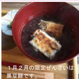
1月2月の限定ぜんざいは 黒豆餅です。