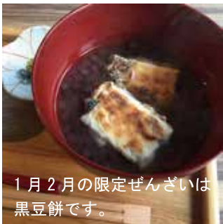
1月2月の限定ぜんざいは黒豆餅です。

振袖とミスキョウコの靴展 とき 1月17日（木）～21日（月） ギャラリーは最終日は16:00まで