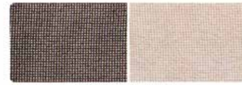
上下左右にまっすぐに高い線を並べたもの

江戸小紋の特徴 江戸時代の武士の袴の柄が起源といわれる江戸小紋は、紋を付ければ礼装にも使えるため茶道などの衣装としても重宝されています。江戸小紋の特徴は、小紋の中でも色無地の感覚に近く、極めて細かい模様を型染めしたものです。柄が非常に細かいため、遠目には無地に見えます。しかしながら、一色で染め上げる色無地とは違い、細かな柄が、色の奥行きを生み、上品で上質な着姿を演出することができ、通の愛好家の中ではとても重宝されます。