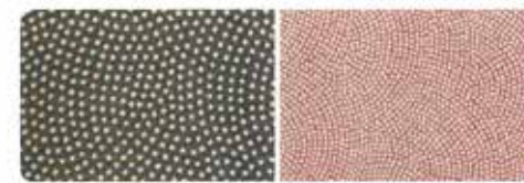
粒や雲の大きさも多種。粒の隙やい隙は総柄徳川家の定小紋。