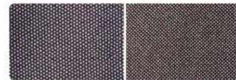
【行儀が良い】よう、お洋服の角底45度と膝を並べたという説も