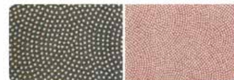
粒や雲の大きさも多種。粒の隙やい隙は総柄徳川家の定小紋。