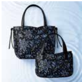
2014年新作 ヴィオルザ